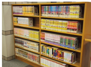
英語マンガ@附属大学図書館